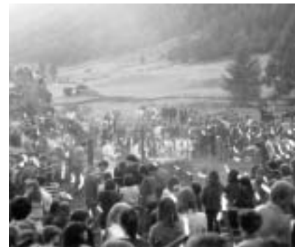
Am 18. September 1980 pilgerte die Dekanatsjugend das erste Mal von Taufers durch das Ahrntal nach Heilig Geist. Gedacht war die Veranstaltung als Antwort auf den diözesanen Bekenntnistag der Jugend, welcher im Mai zuvor in Bozen unter dem Motto „Der Mensch lebt nicht vom Brot allein“ stattgefunden hatte.