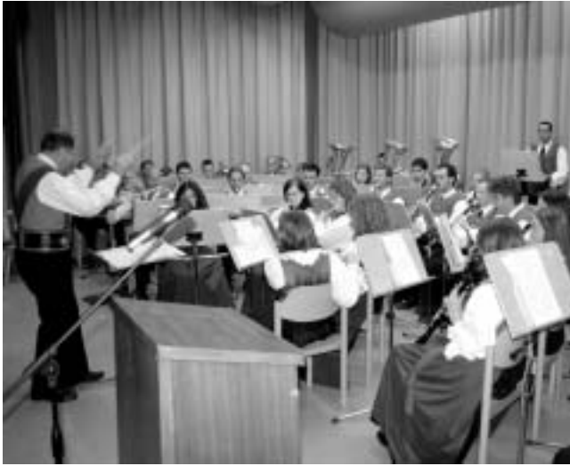
Nach dem Wortgottesdienst versammelt sich die festliche Gemeinde im Pfarrsaal zum Festakt, der von der Musikkapelle musikalisch umrahmt wird.