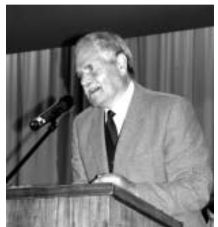
Bürgermeister Max Brugger