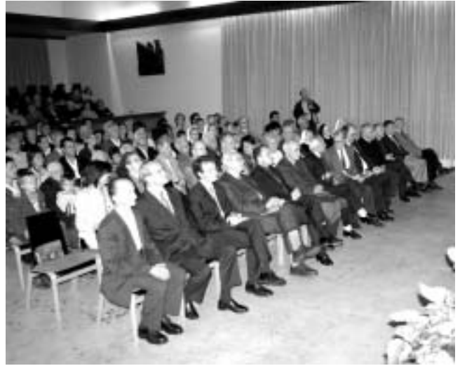
Der Jubilar und seine Gäste lauschen den festlichen Klängen, den Grußworten, den heiteren Versen...